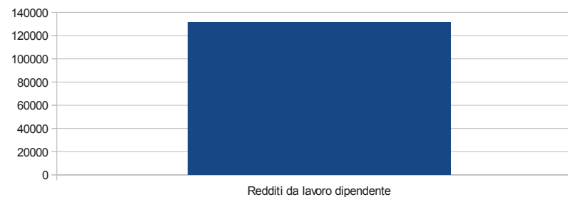
Impegni di parte corrente 2021

fino al 17/11/2021 – cfr – mappa struttura organizzativa e contabile