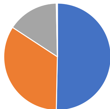
Distribuzione principali Fattori Produttivi